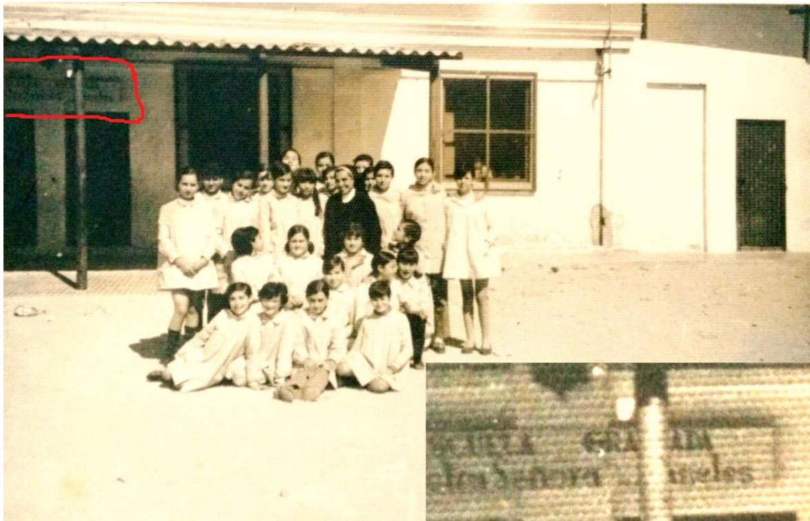
Hermana de la Compañía de María y alumnas de la E. G. Ntra. Sra. de los Ángeles, a las puertas del colegio, en el margen inferior aumentado, rotulo con el nombre del centro.

nombre, siendo este más vinculado y arraigado en el barrio, que la denominación