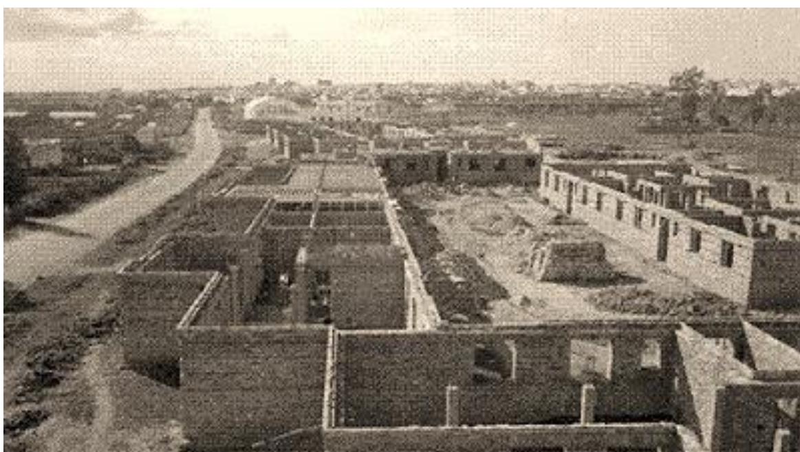
Construcción de la barriada

economato, que vino a sustituir al que existía en la calle San Rafael, este nuevo economato estuvo activo hasta finales de los años 90.