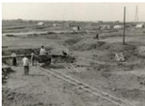
Manchón de las Anclas

La Empresa Nacional Bazán, construye un total de 704 viviendas para sus obreros, a régimen de alquiler y a precios muy moderados.