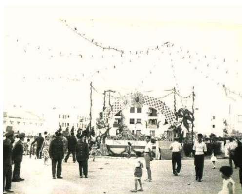
Velada Nuestra Señora de los Ángeles, año 1960